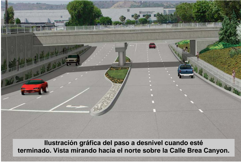
Ilustración gráfica del paso a desnivel cuando esté terminado. Vista mirando hacia el norte sobre la Calle Brea Canyon.

If you would like this information in English, please call (888) ACE-1426.