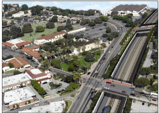
鐵路地下槽完工模擬圖