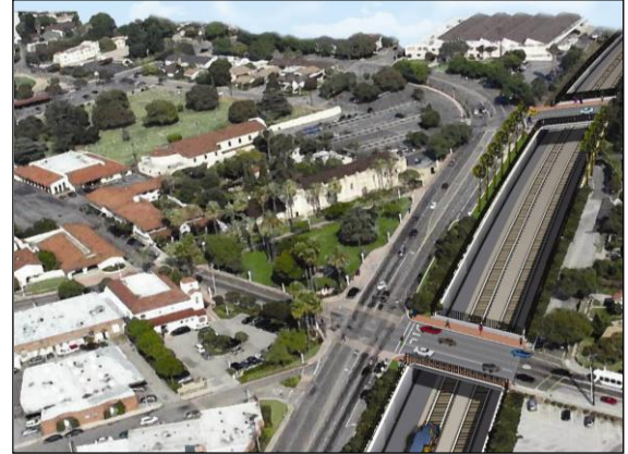
Ilustración gráfica del proyecto después de su terminación