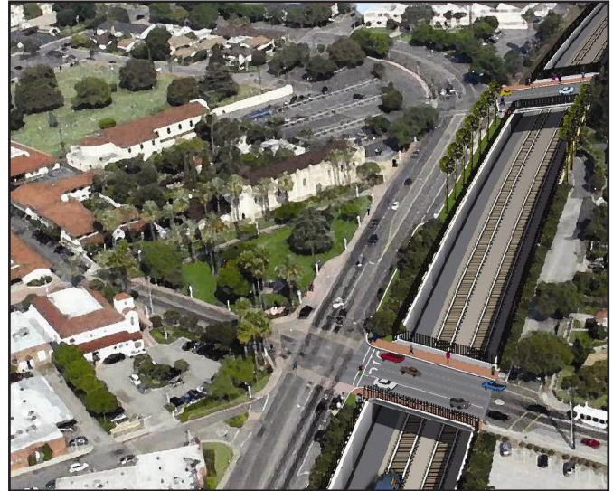
Ilustración gráfica del proyecto después de su termi-