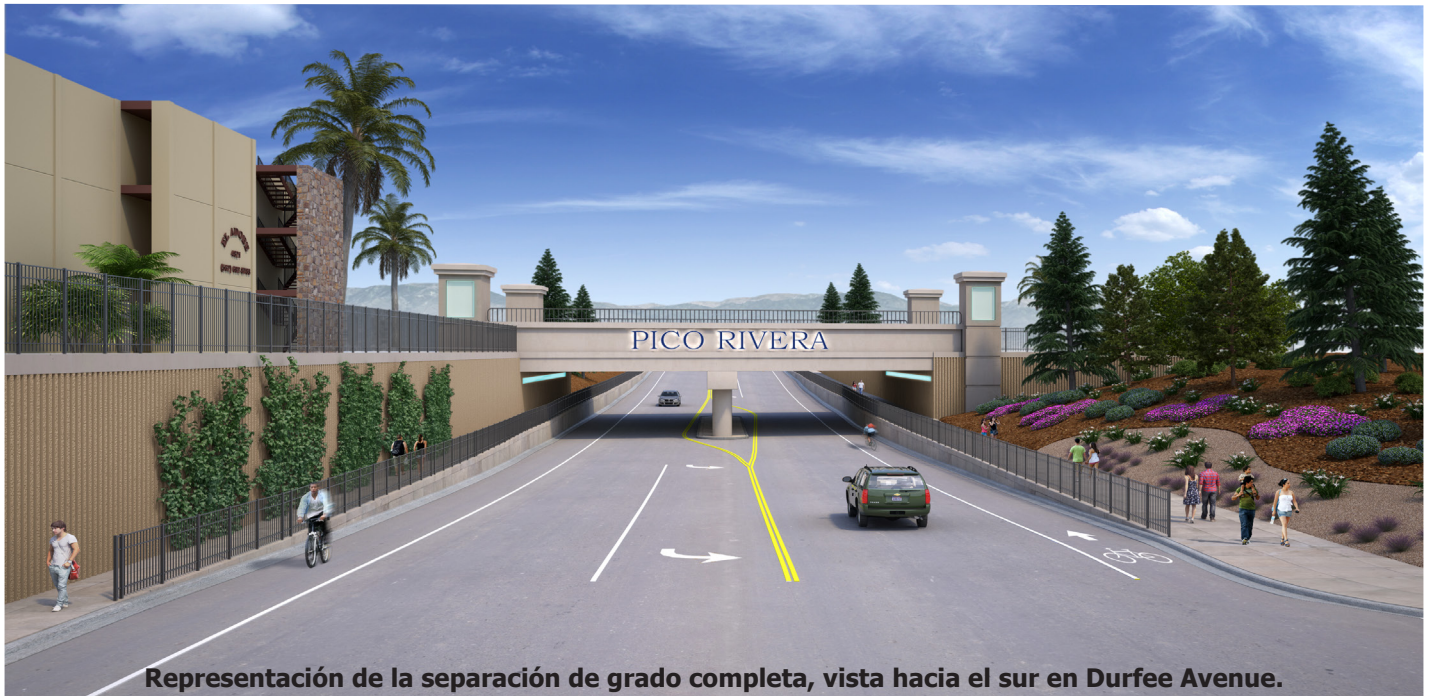
Representación de la separación de grado completa, vista hacia el sur en Durfee Avenue.

AVENIDA DURFEE SE CERRARA EN EL CRUCE DE FERROCARRIL EL 3 DE FEBRERO POR 27 MESES PARA LA CONSTRUCCIÓN DE UN PASO INFERIOR; ACCESO LOCAL SE MANTENDRA