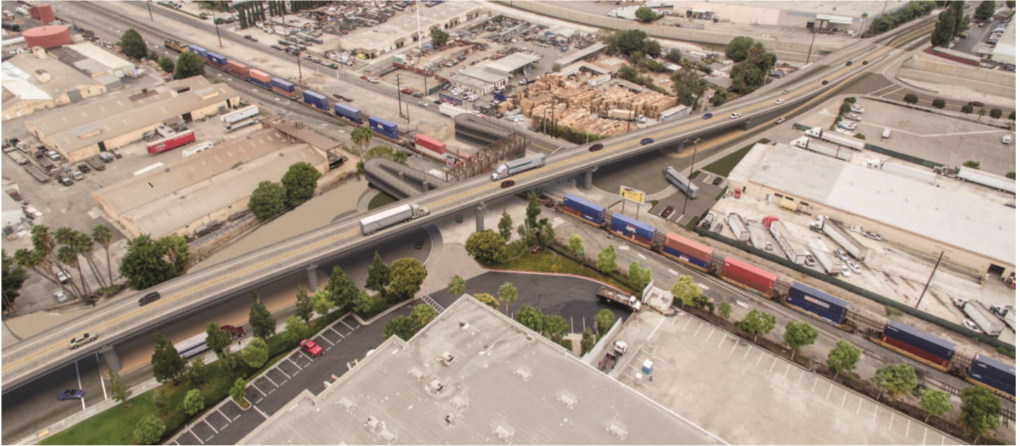
Representación del paso elevado de la carretera terminada en Turnbull Canyon Road