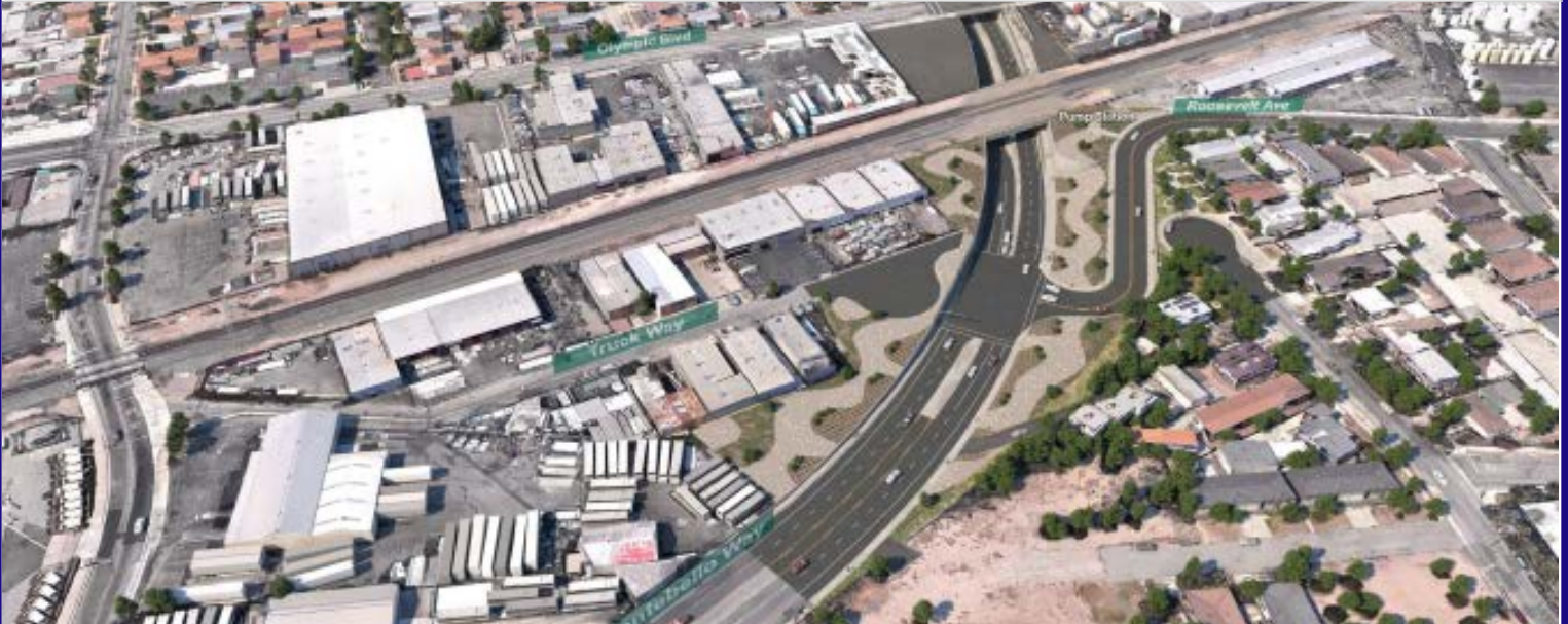
Rendering of the planned roadway underpass on Montebello Boulevard between Los Angeles Street and Greenwood Avenue

Please join us for a Community Open House to learn more about the project and what to expect during construction